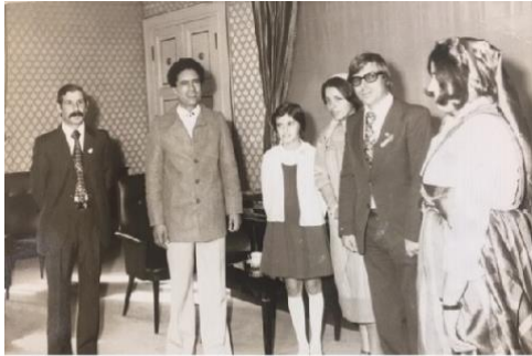
1976 LİBYA ALTERNATİF OLİMPİYADI EN KÜÇÜK SATRAŇ SPORCUSU GÖLSEVİL YILMAZ KADDAFİ İLE SARAYINDA

Bu Olimpiyatta en küçük satranç sporcusu olarak beni davet etmesi ve görüşmesi hayatım boyunca unutamadığım ve unutamayacağım her zaman gururla anlatacağım bir anımdır.